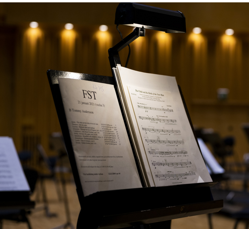
Till vänster: Fokus på ny svensk orkestermusik vid orkesterpresentationsdagen i Västerås i januari 2022.