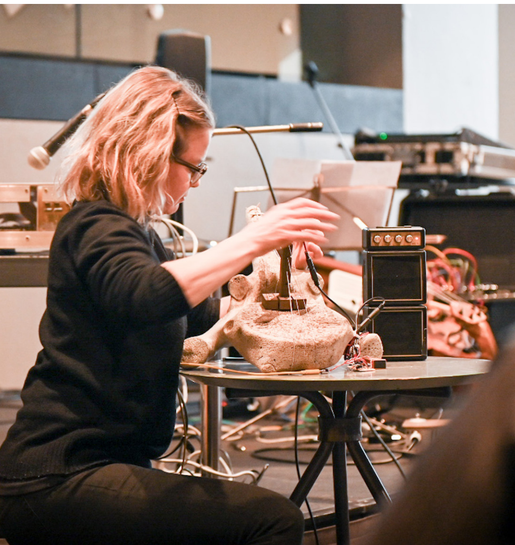
Till vänster: Invigningskonsert vid Nordic Music Days 2022.