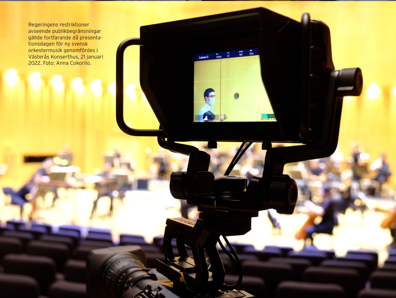
Regeringens restriktioner avseende publikbegränsningar gällde fortfarande då presentationsdagen för ny svensk orkestermusik genomfördes i Västerås Konserthus, 21 januari 2022.