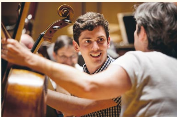
Det var med lätta händer MSO tog sig an det nya materialet.