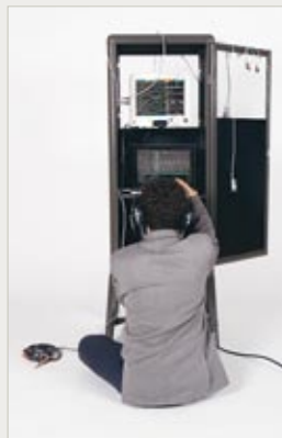
Sjukhusets patientmonitörer fascinerade Hardi Kurda så mycket att han skapade ett instrument av dem.