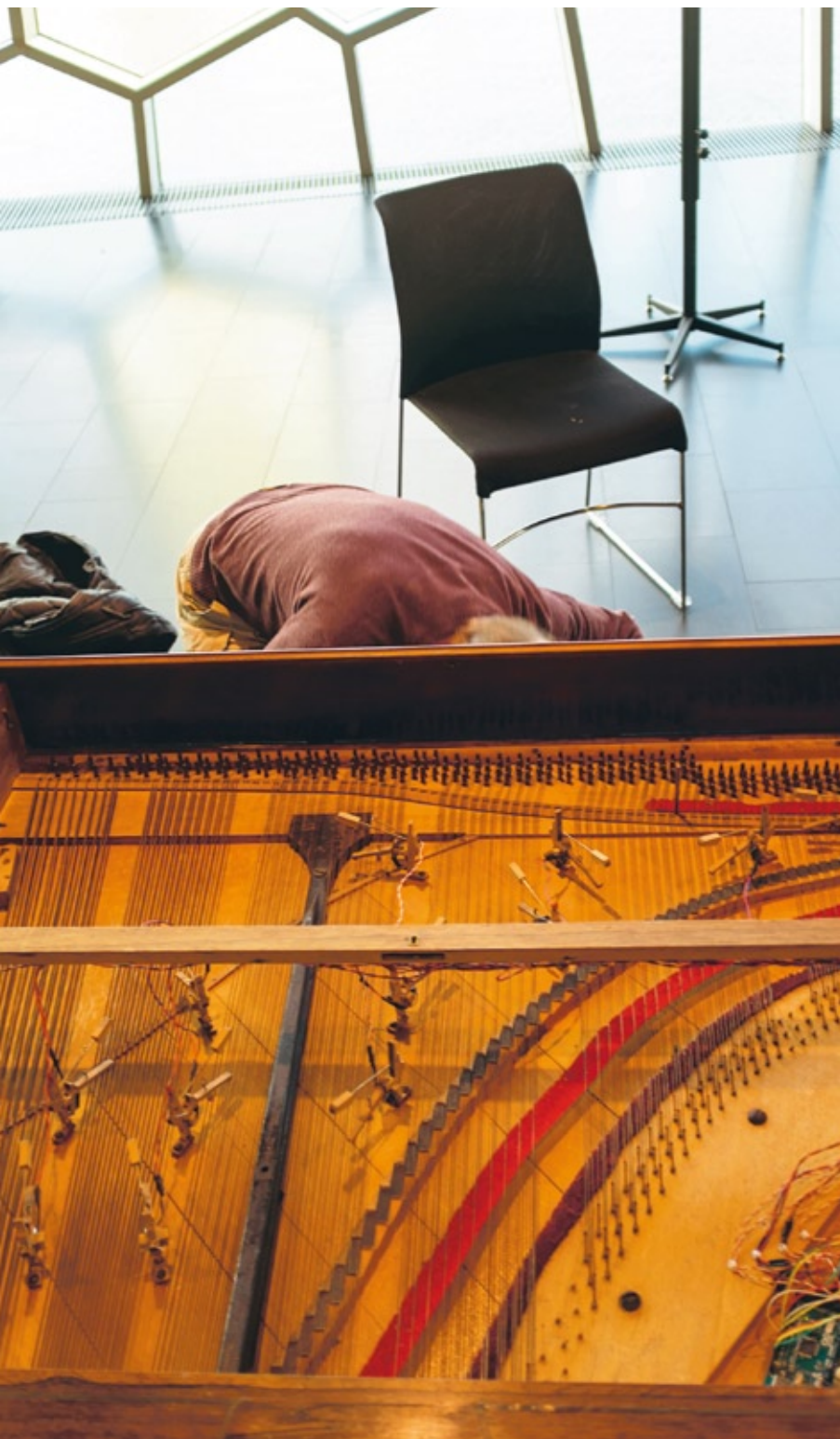
En av de flertalet ljudinstallationer som visades under festivalen.

→ ta i verket, det ger en tydlig kroppslig känsla. Det sista verket fångar åter in mig i en känsla av karghet och ödslighet. Det är skört vackert, stråktonerna upphör nästan ibland och taglets mjuka beröring på strängarna är det enda som anas. Jag andas knappt.