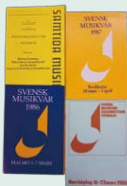
Programbladen till Svensk Musikvår är fotograferade i Riksarkivet i Arninge.