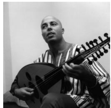
Dhafer Youssef, sångare och oud-spelare

Något om festivalens bredd säger väl också antalet presenterade upphovsmän (50) och spridningen på alla de scener man använder; jazzklubben Nefertiti, Pusterviksteatern, Artisten, gator och