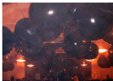
Arkitektthögskolan utsmyckades vid konserten med jätteballonger, rök och avancerad ljussättning.

I programrådet har vi arbetat med fem teman för att ge varje konsert en profil. De fem temana var Världen och Norden, Musik Ord Bilder, Musik Rum Rörelse, Tradition och till sist Experiment. Min erfarenhet blev att de var till stor hjälp under programsättningen, avsatte några bra artiklar (se hemsidan: http://www.nordicmusicdays.com under fliken Press Room) men att jag under konserternas gång aldrig kom att tänka på den idémässiga bakgrunden. Radiounderhållningsorkestrernas konsert på Arki-