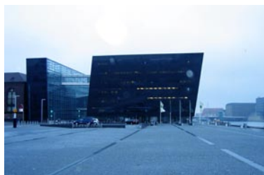
The Black Diamond.

Den stora satsningen i årets festival var invitationen av tre utomordentliga europeiska ensembler. Förutom de utvalda verken bad vi dem sätta några egna verk på programmet. Söndag till tisdag spelade de i Den svarta diamanten, en nybyggd konsertsal ut mot