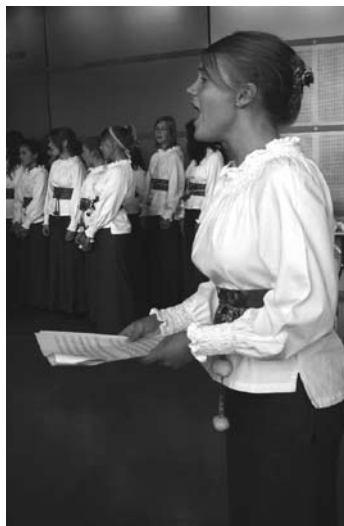
Adolf Fredriks Flickkör